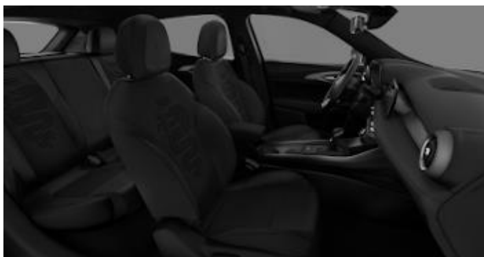
030 – Stofa neagra cu logo "Biscione" (standard Super)