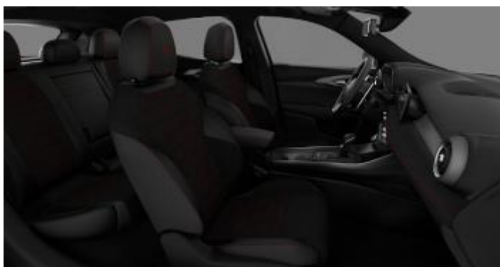
027 / 783 – Alcantara neagra cu accente de culoare rosie (standard Veloce)