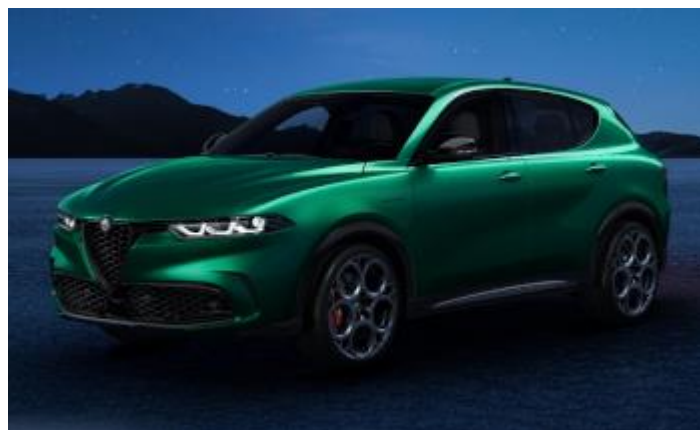
6FW (398/D) - Verde Montreal