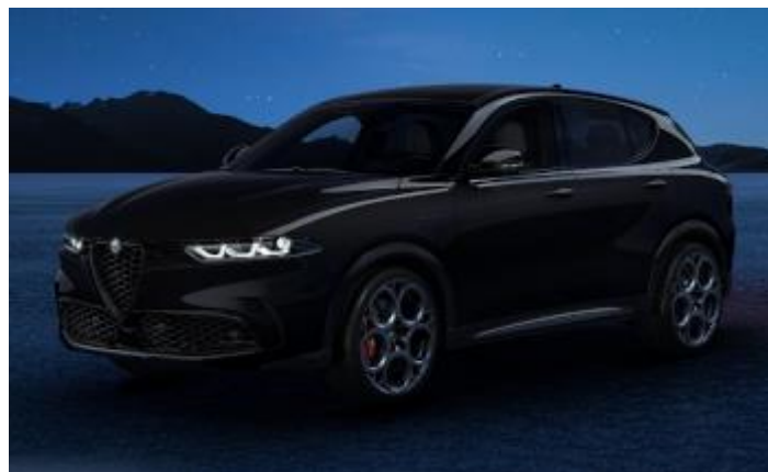
6FX (601) - Nero Alfa