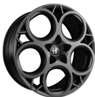
1M4 R20 – Optional Ti / Veloce