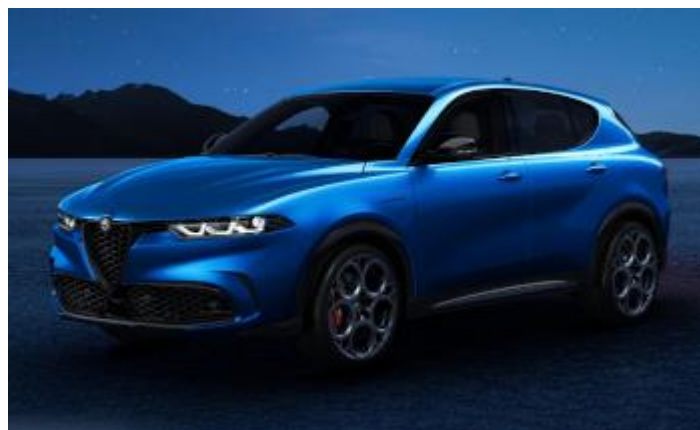
3YS (756/A) - Blu Misano