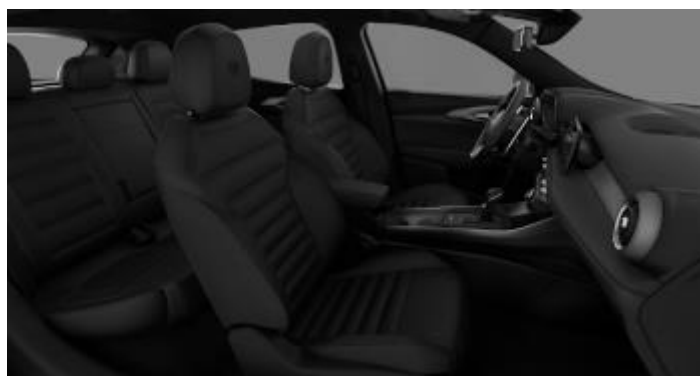
33R (428) – Piele perforata neagra si cusatura gri (optional Sprint / Ti / Veloce)